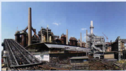
Weltkulturerbe Völklinger Hütte