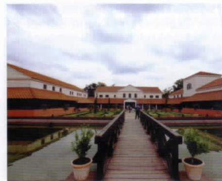
Römische Villa Borg

wegen ausreichend Gelegenheit. Der „Saarland-Rundwanderweg“ sowie der „Saar-Hunsrück-Steig“ als Fernwanderwege liegen quasi vor der Haustüre. Darüber hinaus hat man die Wahl zwischen zahlreichen Premiumwanderwegen mit unterschiedlichen Schwierigkeitsgraden.