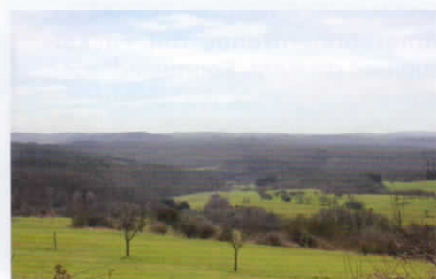
Der Weg nach Trier Michaela Toepper