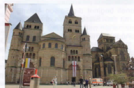
Der Dom in Trier, Michaela Toepper

D ie „Stausee-Tafeltour“, der „Saarhölzbach-Pfad“, der „Schluchten-Pfad“ und der „Waldsaum-Weg“ - um nur einige zu nennen - befinden sich in unmittelbarer Nähe zu unserem Gelände. Wegen der zentralen Lage ist das Vereinsgelände des „Licht-