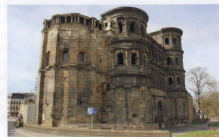
Porta Nigra in Trier, Michaela Toepper

Z um Verbrennen der dabei erworbenen Kalorien hat man schließlich auf zahlreichen gut ausgewiesenen Rad- und Wander-