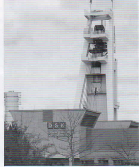
Grube Ensdorf Nordschacht

gangspunkt für zahlreiche Ausflüge und Exkursionen an. Städte wie Trier (Porta Nigra und Dom), Metz (Kathedrale mit berühmten Chagall-Fenstern), Saarbrücken (Schloss und Ludwigskirche), Saarlouis (ehemalige Garnisonstadt mit Katakomben), Mettlach (Villeroy und Boch) und Saarburg (Burg und romantische Altstadt) sind in weniger als einer Stunde mit dem Auto zu erreichen. Im „ Weltkulturerbe Völklinger Hütte “ oder dem Bergbaumuseum „ Carreau-Wendel “ in Petite-Rosselle kann man auf interessante Weise der von Kohle und Stahl geprägten industriellen Vergangenheit der Region nachspüren, solch reizvolle Orte wie die „ Saarschleife “ als Wahrzeichen des Saarlandes oder das „ Villeroy und Boch-Erlebniszentrum “ in Mettlach, die römische Villa in Borg besuchen oder sich auf einer der Gartenterrassen der zahlreichen Gastronomiebetriebe rund um den Losheimer Stausee die gute saarländische Küche bei „Dibbelabbes“, Lyonerpfanne oder Schwenkbraten schmecken lassen.